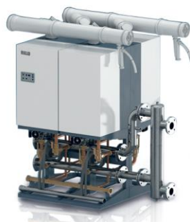
Potenza KW 115